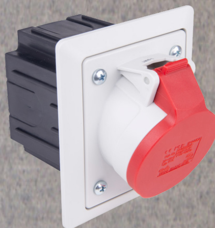
Gniazdo czerwone z puszką podtynkową i ramką 80 x 97mm, kołnierzyk jasnoszary, IP 44/54