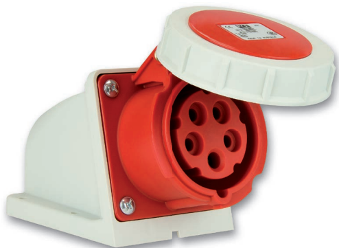
Nr kat. 1152-6